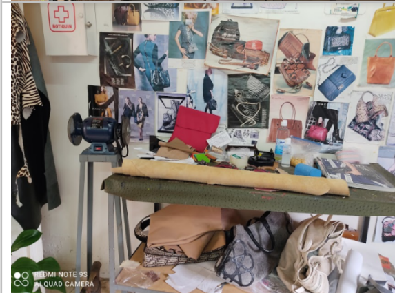
Taller de manufactura. Detalle de mesa de trabajo donde se realizan las actividades de marroquinería y máquina pulidora.