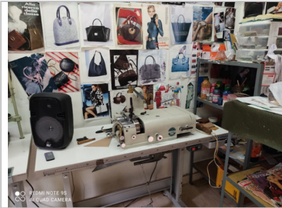
Taller de manufactura de Alfredo Tobón. Detalle de la desbastadora.