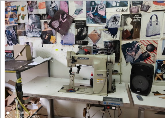
Taller de manufactura. Detalle de la máquina de coser.